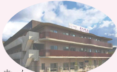
特別養護老人ホーム まごころ園