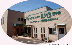
ケアセンターまごころ西宇治